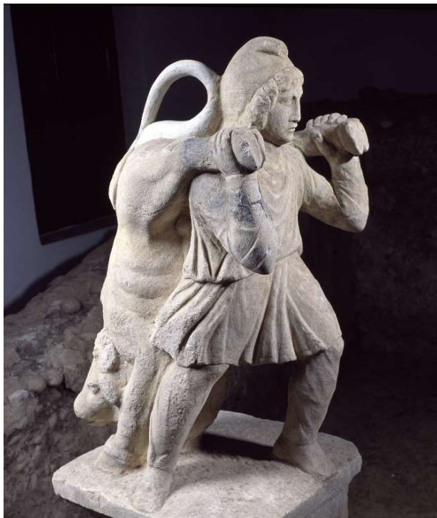
Bikonosec, I. mitrej na Spodnji Hajdini