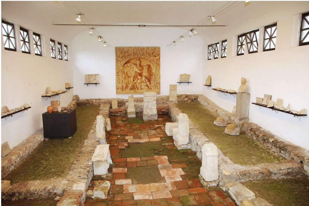
Notranjost III. Mitreja na Zgornjem Bregu