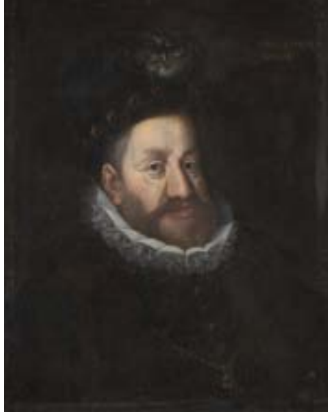
CESAR RUDOLF II.