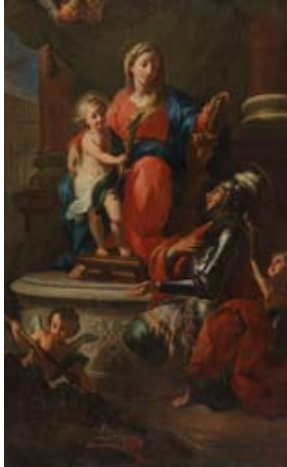
MARIJA Z JEZUSOM IN SV. JURIJEM

V zadnji, peti sobi galerijske zbirke so razstavljene slike iz druge polovice 17. in iz 18. stoletja. Poleg dveh nabožnih slik so razstavljena še tihožitja, krajinske podobe, bitke in podoba psa. Zaradi dovršenosti zbužata občudovanje dve nabožni sliki. Počitek na begu v Egipt iz časa po letu 1720, ki ga je naslikal Giovanni Odazzi (1663–1731). Poleg ptujske poznamo to kompozicijo še v dveh verzijah: ena je v Walters Gallery v Baltimoru, druga pa je v zasebni lasti. Slika izvira iz gradu Vurberk. Velika oltarna slika Marija z Jezusom in sv. Jurijem je delo Martina Altomonteja (1657–1745) iz leta 1727. V ptujski muzej je bila prenesena leta 1953 iz grajske kapele v Veliki Nedelji.