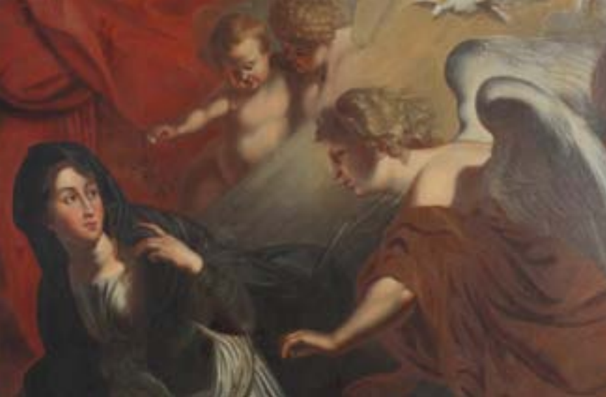
MARIJINO OZNANJENJE, DETAJL