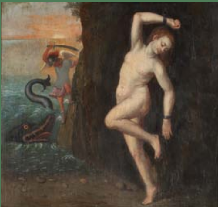
PERZEJ IN ANDROMEDA