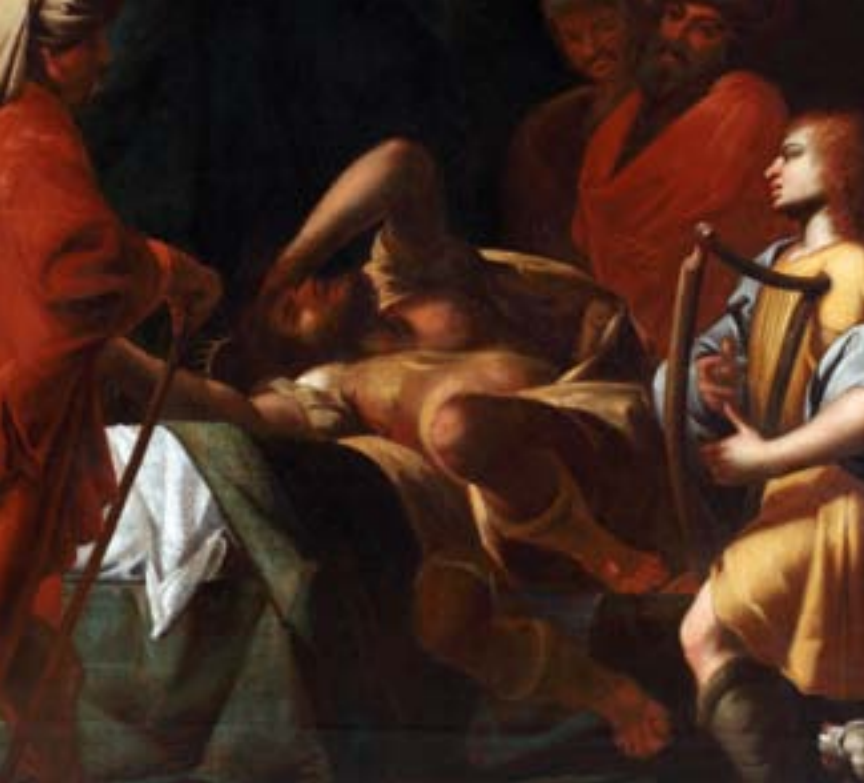
DAVID PRED SAVLOM, DETAJL