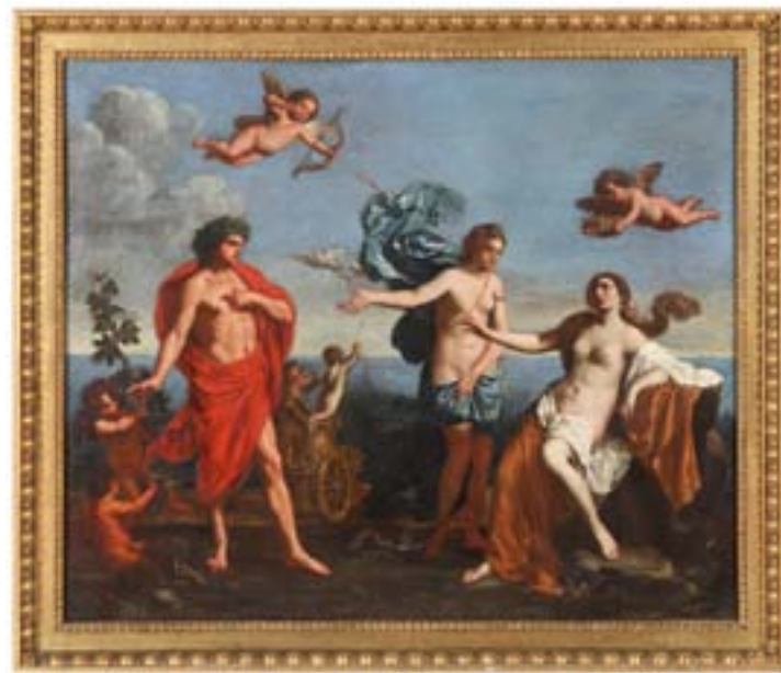
BAKH IN ARIADNA

posnemovalci Hansa von Aachna. Slika Bakh in Ariadna je datirana v sredino 17. stoletja in pripisana Giacintu Gimignaniju (1606–1681). V italijanskem baročnem slikarstvu popularen motiv so navdihnile Ovidijeve Metamorfoze. Slogovno je slika zelo klasicistično ubrana in glavne figure temelje na vzorcih antičnih skulptur. Slika je sad umetnikove zrele dobe.