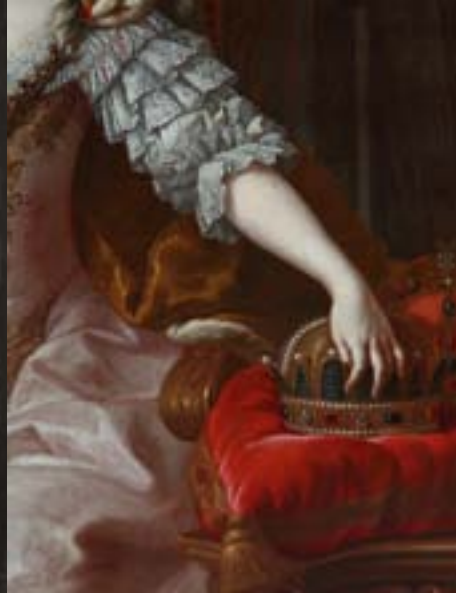
CESARICA MARIJA TEREZIJA, DETAJL S KRONAMA SV. ŠTEFANA IN SV. VENČIJA