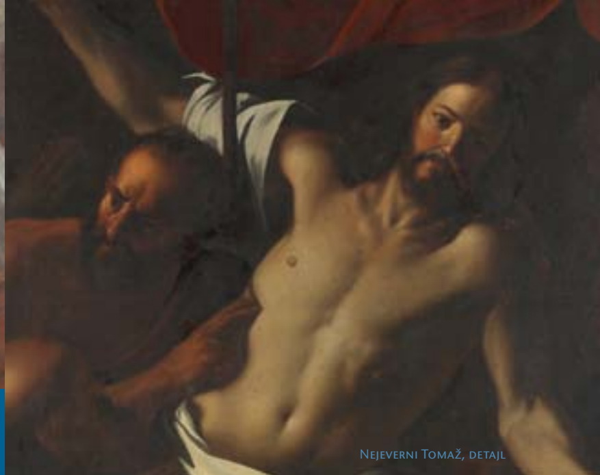
NEJEVERNI TOMAŽ, DETAJL

jo hrani Grajska galerija v Pragi. Zadnja slika v tem prostoru je Marijino oznanjenje , katere original je naslikal Peter Paul Rubens (1577–1640) med letoma 1610 in 1612 in je sedaj shranjena v Umetnostnozgodovinskem muzeju na Dunaju.