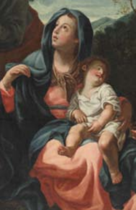
POČITEK NA BEGU V EGIPT, DETAJL