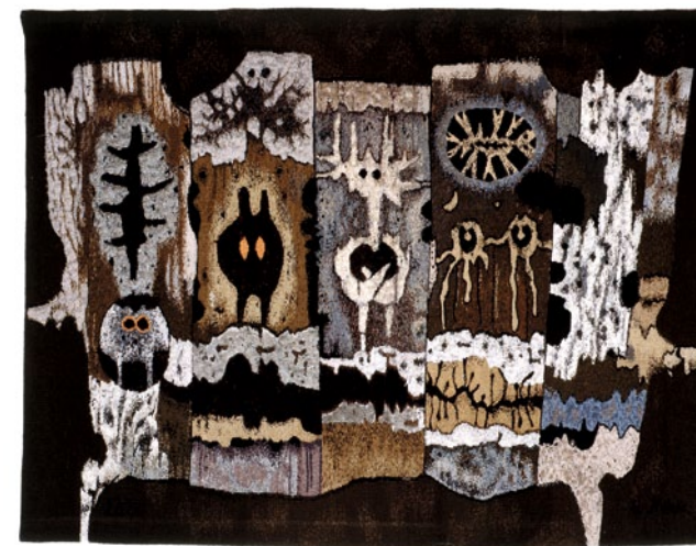
Velika vrata, UO 1845 T tapiserija, 1,53 x 1,89 m, tkalka: Etelka Tobolka sign.d.sp.: Fr. Mihelič Ljubljana 1972, Novi Sad 1974