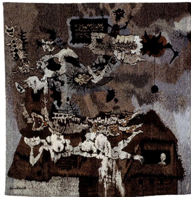
Rojstna hiša z Lucijo, UO 1844 T tapiserija, 2,53 x 2,45 m, tkalka: Etelka Tobolka sign.l.sp.: Fr. Mihelič Ljubljana 1975, Novi Sad 1976