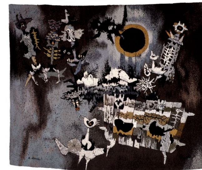
Noč nad Gorjanci II, UO 1598 T tapiserija, 2,59 x 3,22 m, tkalka: Etelka Tobolka sign.l.sp.: Fr. Mihelič Ljubljana 1973, Novi Sad 1984